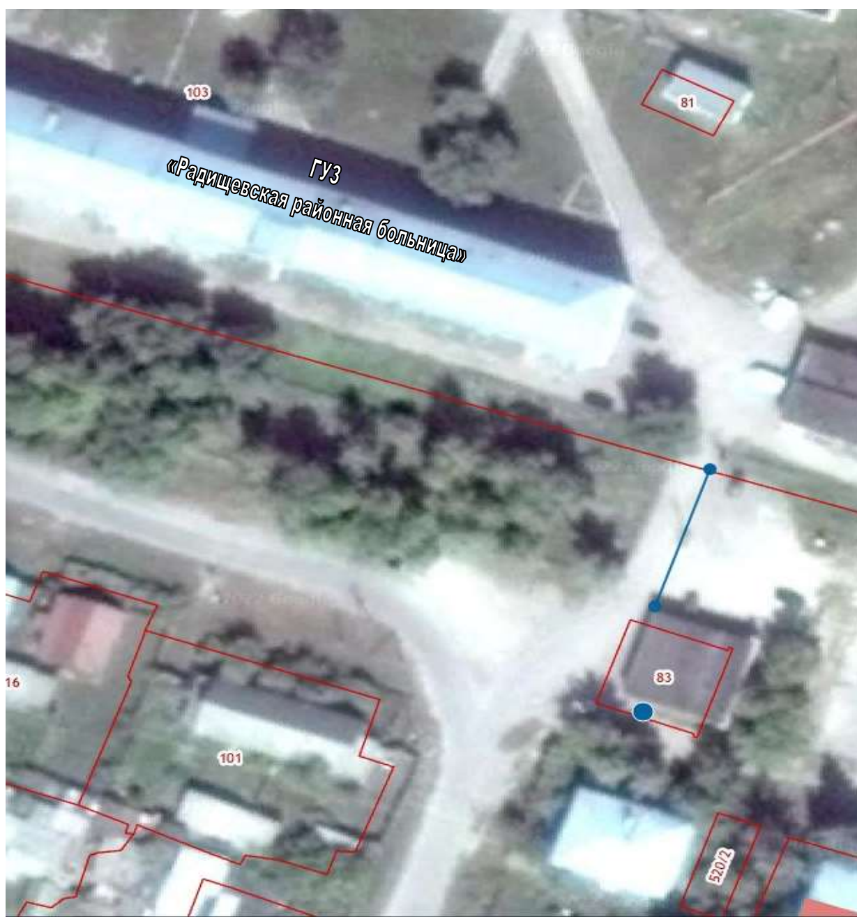
СХЕМА границ прилегающих территорий для ГУЗ «Радищевская районная больница»