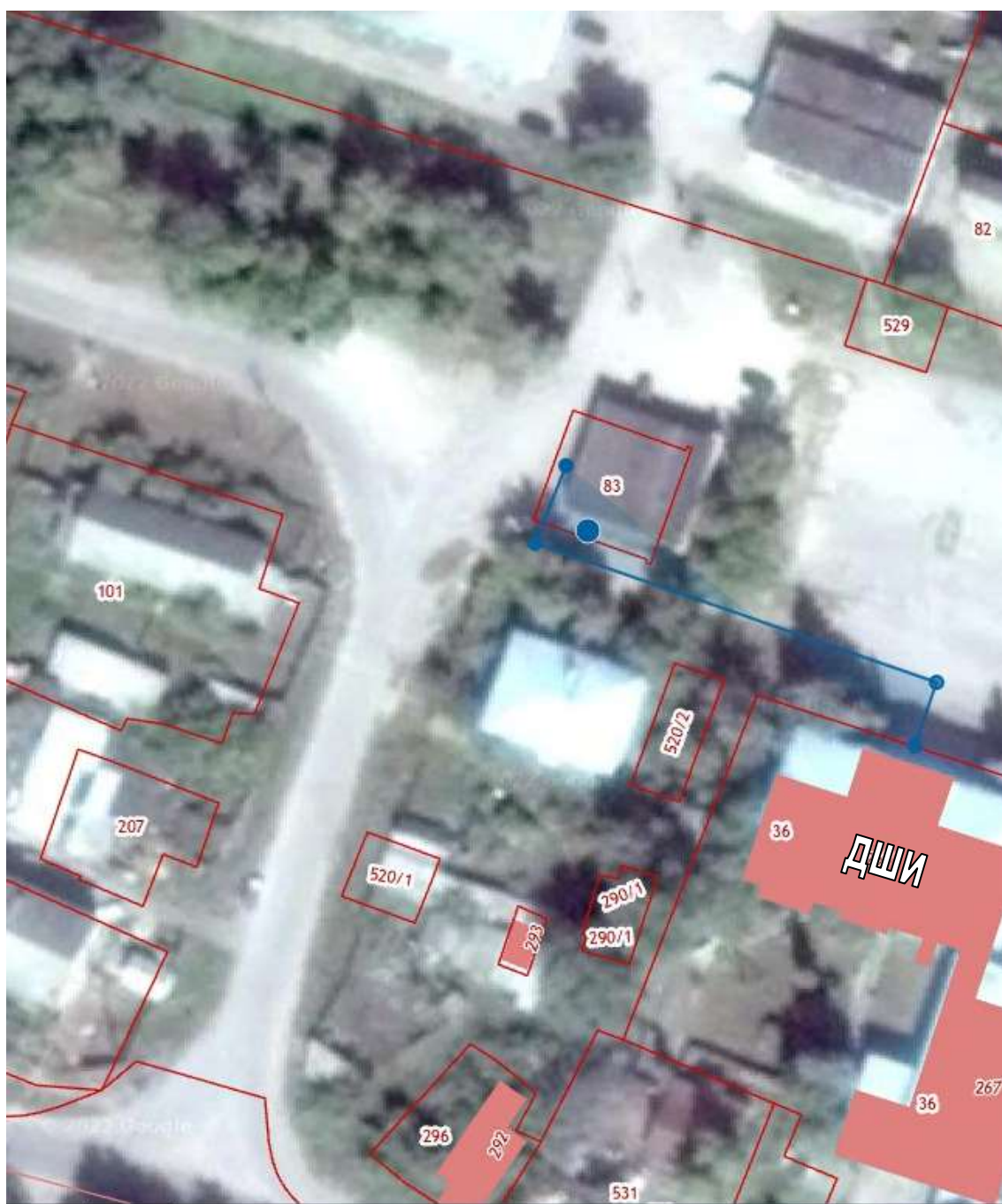
СХЕМА границ прилегающих территорий для МБУ ДО «Радищевская детская школа искусств»