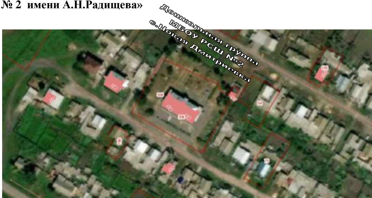
СХЕМА границ прилегающих территорий для муниципального бюджетного общеобразовательного учреждения «Радищевская средняя школа № 2 имени А.Н.Радищева»

ПРИЛОЖЕНИЕ № 7 к постановлению Администрации муниципального образования «Радищевский район» Ульяновской области от _____ № _____