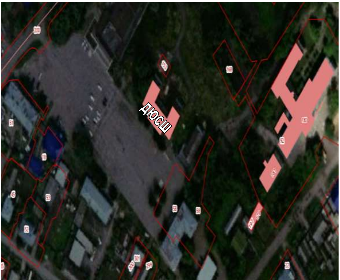
СХЕМА границ прилегающих территорий для МУ ДО «Детско-юношеская спортивная школа»