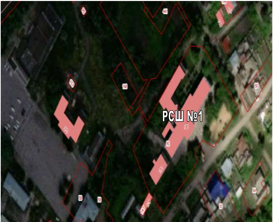
СХЕМА границ прилегающих территорий для МБОУ «Радищевская средняя школа № 1 имени Героя Советского Союза Д.П.Полынкина»

ПРИЛОЖЕНИЕ № 4 к постановлению Администрации муниципального образования «Радищевский район» Ульяновской области от _____ № _____