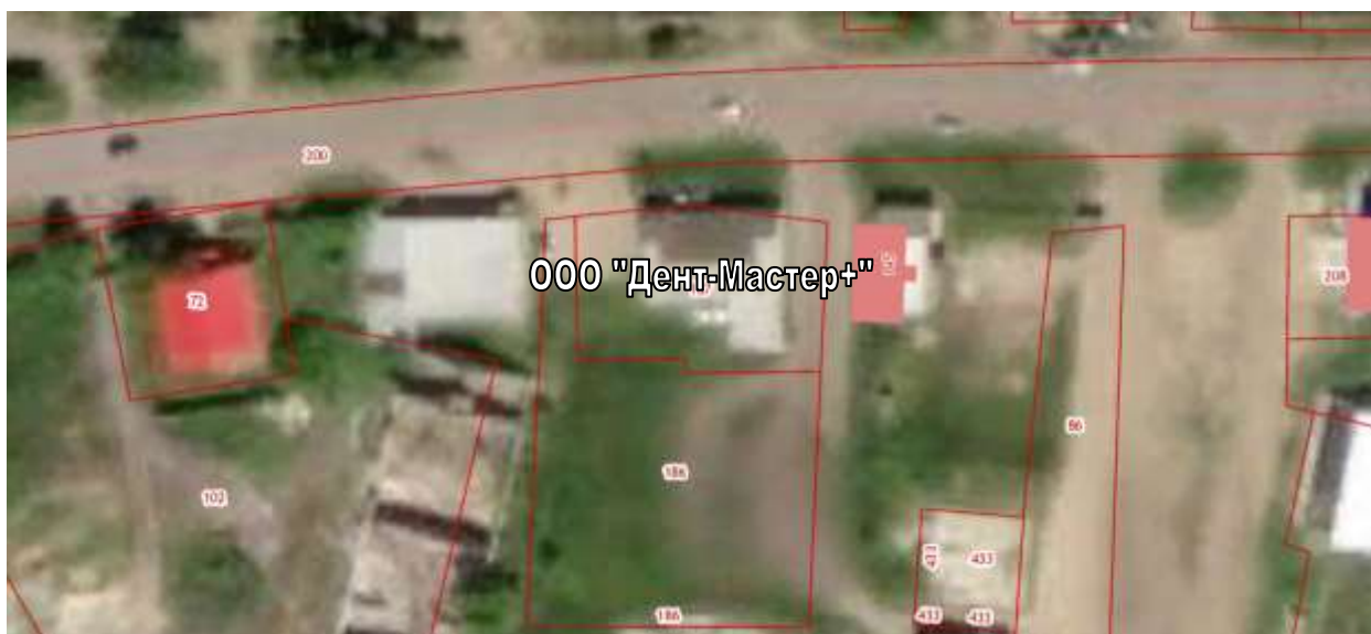
СХЕМА границ прилегающих территорий для «ООО «Дент-Мастер+»»