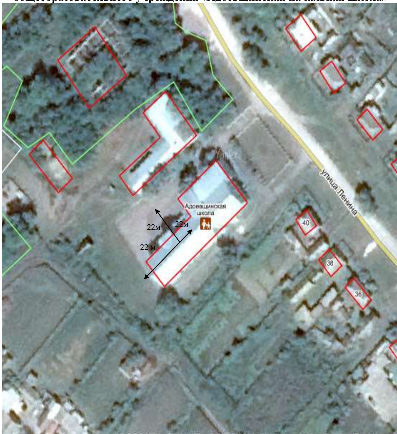
СХЕМА границ прилегающих территорий для муниципального общеобразовательного учреждения «Адоевщинская начальная школа»

ПРИЛОЖЕНИЕ № 11 к постановлению Администрации муниципального образования «Радищевский район» Ульяновской области от _____ № _____