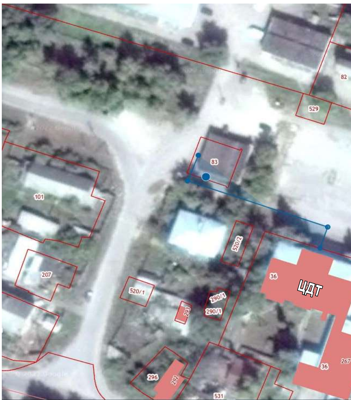
СХЕМА границ прилегающих территорий для МУ ДО «Радищевский центр детского творчества»