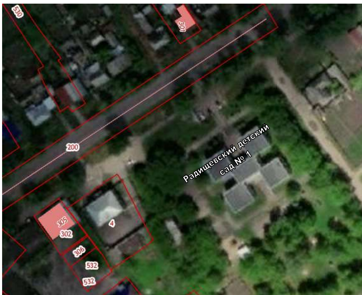
СХЕМА границ прилегающих территорий для муниципального дошкольного образовательного учреждения «Радищевский детский сад №1»