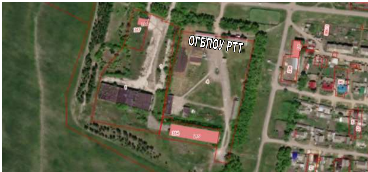
СХЕМА границ прилегающих территорий для «ОГБПОУ РТТ»