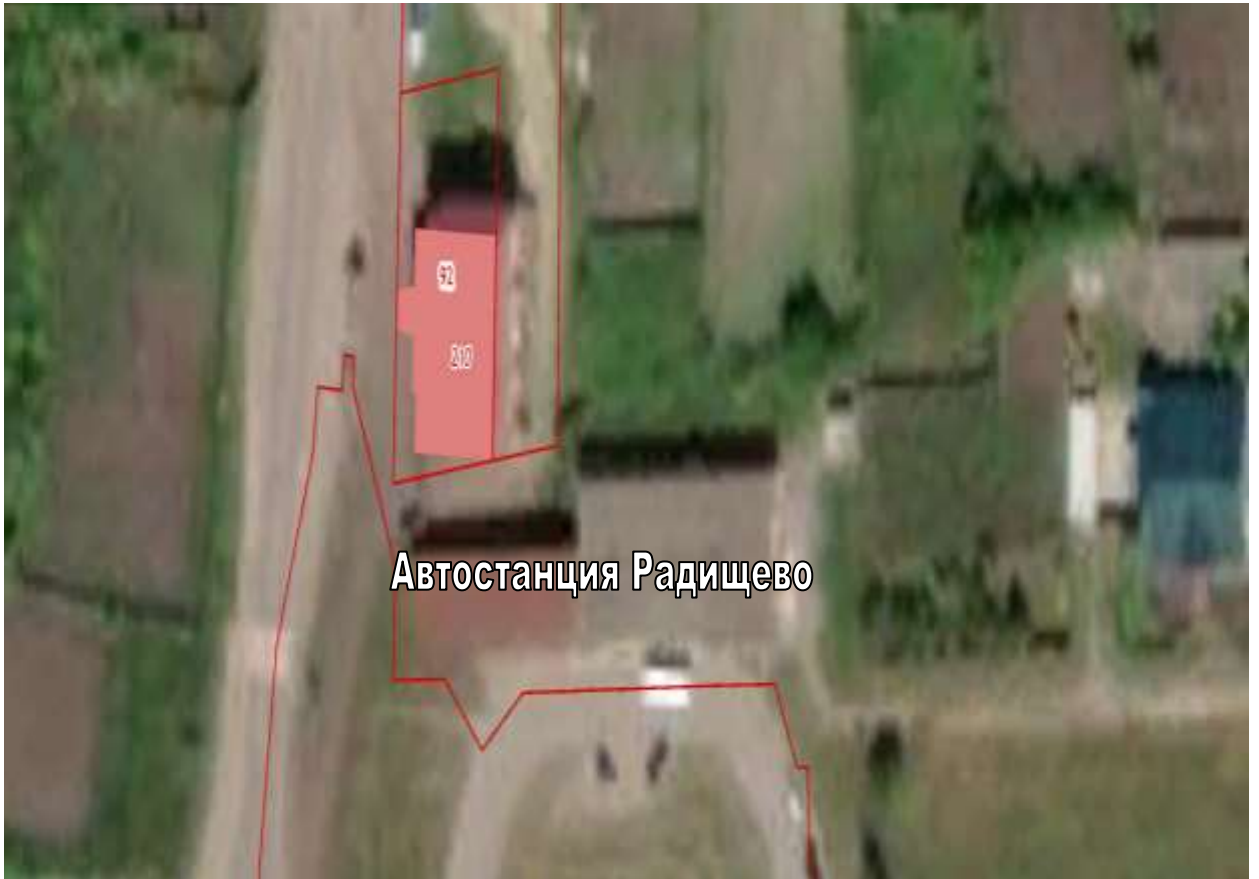
СХЕМА границ прилегающих территорий для «Автостанция Радищево»